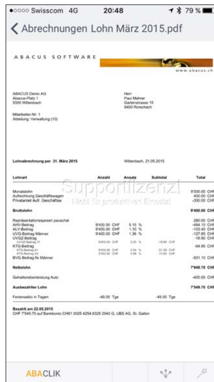
Smartphone App als Informationsdrehscheibe (Employee-Self-Service)